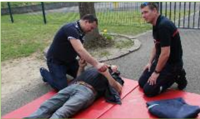
Gestes qui sauvent