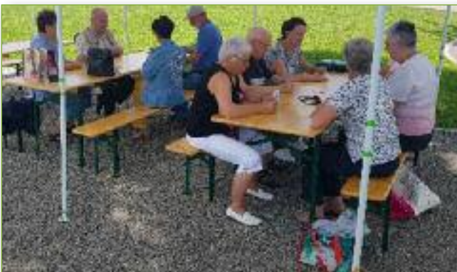
Récré des séniors