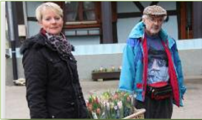
Vente de Tulipes