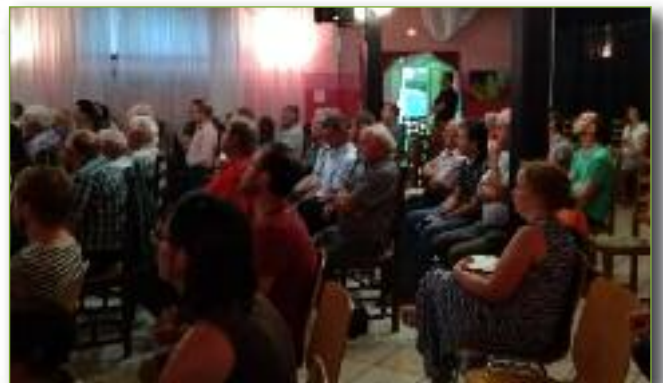
Présentation du projet intercommunal en réunion publique